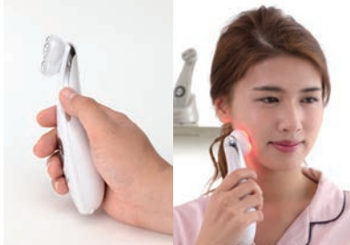
▲그림시 옆 사진

6종류의 빛이 선택가능하고 바디에도 사용할 수도 있습니다. 충전대에 올려놓는 것으로 충전이가능하니 가정에서도 OK 살롱에 갈 시간이 없는 분이나, 홈케어가 필요하신 분들께 드리는 토탈 스킨케어 실현! ※본인 이외의 사람에게 시술 할 경우 EMS기능은 작동하지 않습니다.