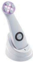
▲거치대 충전시 사진