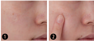
1 신경쓰이는 부분에 올려주세요