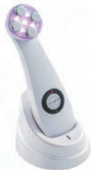
▲겨쳐대 충전시 사진