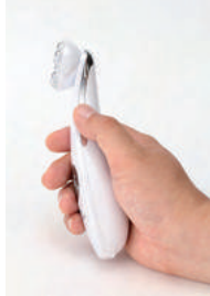
▲그림시 열 사진

빨강-노랑-피랑-핑크-플래쉬 컬러 (핑크 점멸) LED 빛 에스테 가능함니다. 부드러운 빛으로 피부를 보호하면서 깨끗한 피부로 가꾸어 줍니다. 피부 상태에 따라 원하는 빛으로 케어해 보세요.